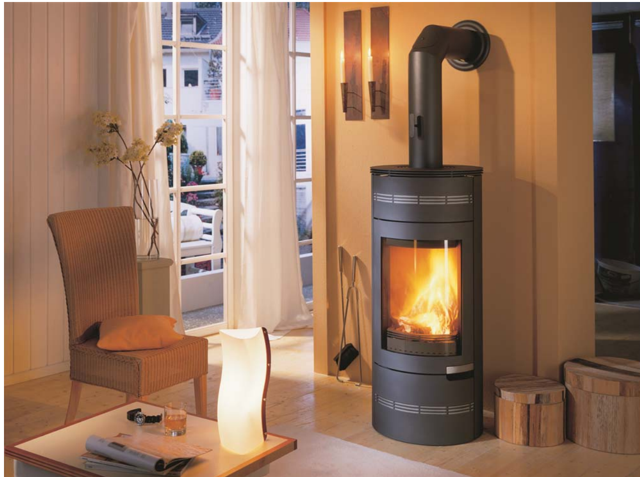
Brændeovnen MENDOLO sort lakeret