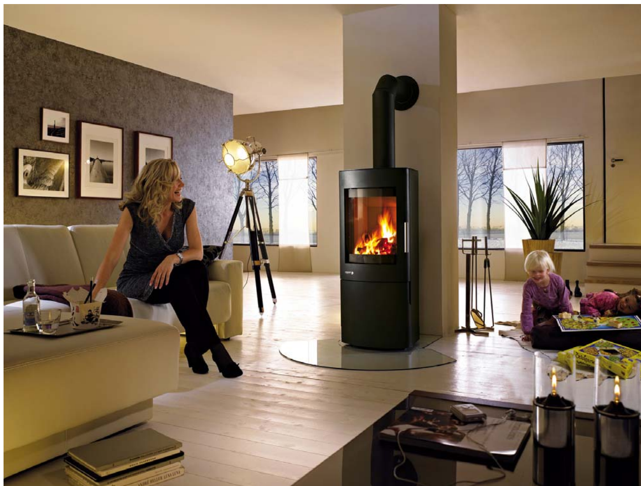
Brændeovn GEROLA sort lakeret